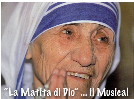
"La Matita di Dio" ... il Musical