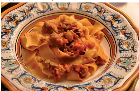
Pappardelle al ragù d'anitra